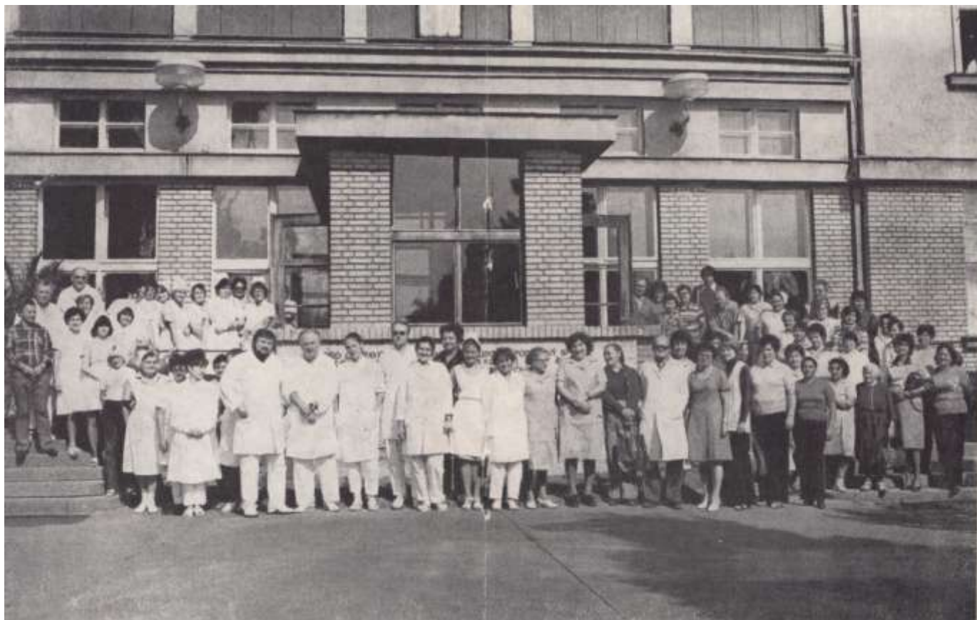
Kolektiv zaměstnanců léčebny v r. 1979.

Navštěvuji zde také společenskou místnost – je tam televize a malá knihovna (obojí volně k dispozici!).